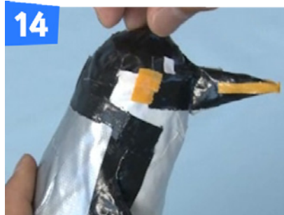
14 小さくちぎったテープ(白)で目をつけます。