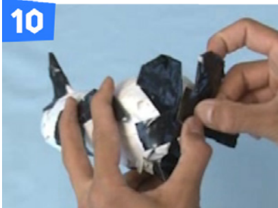
10 胴体の底面にテープ(黒)で足をつけます。