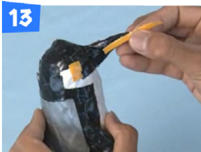
13 細くさいたテープ(黄)でくちばしに線を入れます。