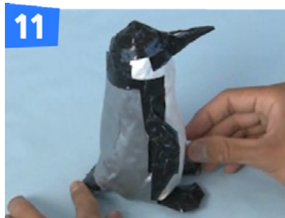
11 背中をシルバー、頭を黒のテープで覆います。