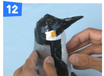
12 小さくちぎったテープ(黄)で頬の部分に模様をつけます。